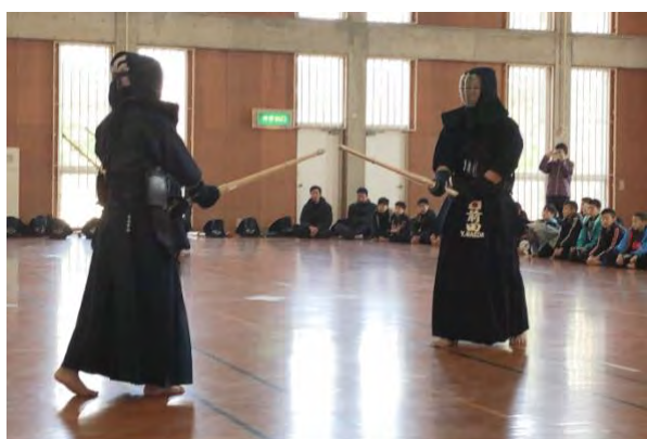
前田選手と合同稽古をしている様子