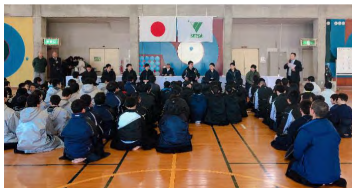
前田選手にインタビューしている様子