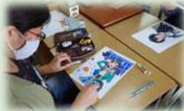
コミックイラストゼミ