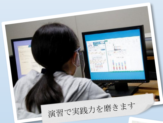
演習で実践力を磨きます