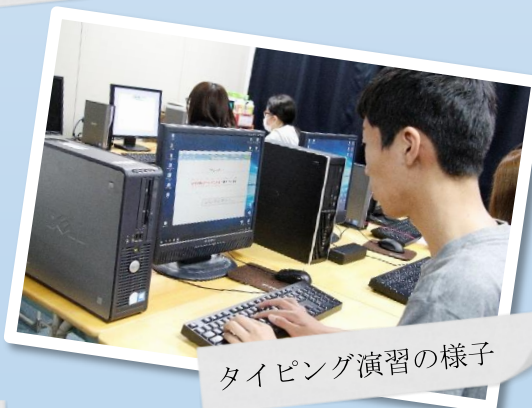
タイピング演習の様子