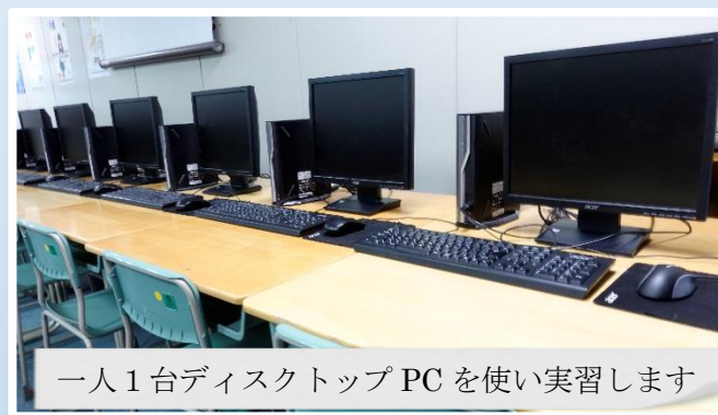
一人1台デスクトップPCを使い実習します