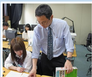
個々の弱点克服。合格率UP