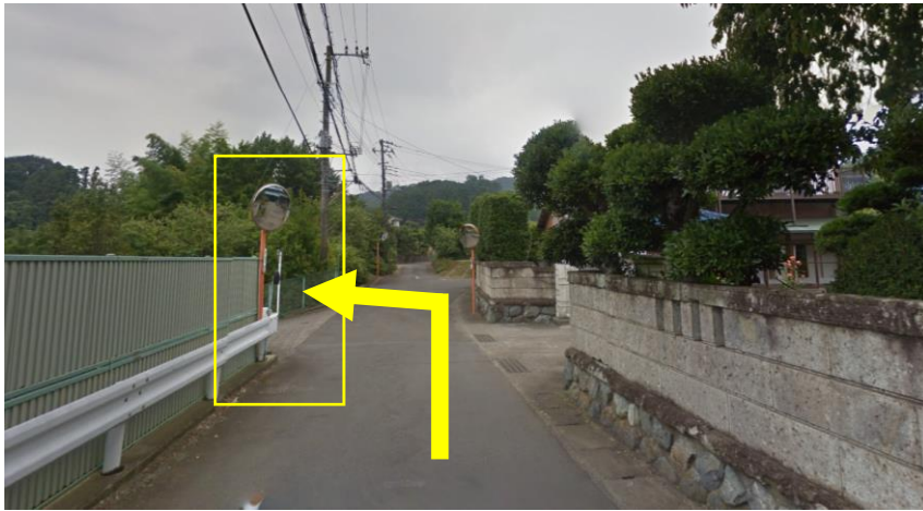
① ルームミラーを左折