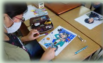
コミックイラストゼミ