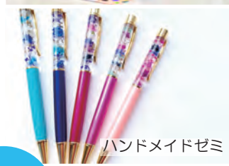
ハンドメイドゼミ