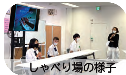
しゃべり場の様子